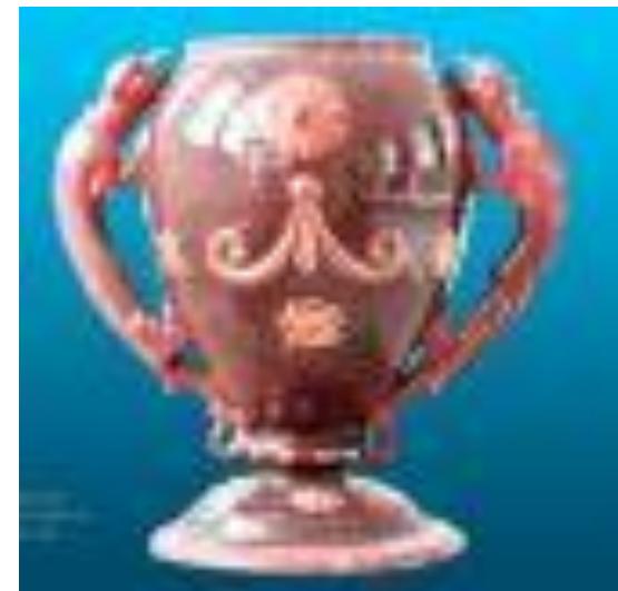
Rózsaszín Zsolnay Kiállítás